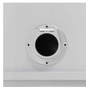
Modelli con ingresso centrale