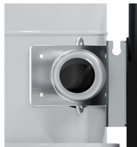
Modelli con ingresso tangenziale